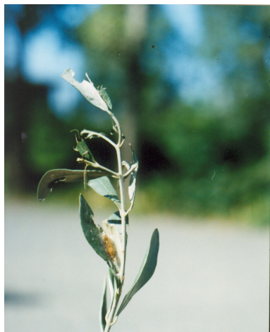
شکل ۷- شفیره P. unionalis ما بین برگ‌های زیتون Fig. 7- Pupa of P. unionalis formed among leaves