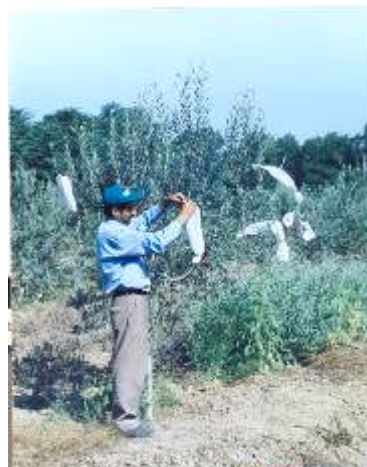
شکل ۸- آستین‌های توری Fig. 8- Gauzy sleeve cages