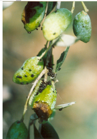
شکل ۱۰- خسارت P. unionalis روی میوه زیتون Fig. 10- Damage of P. unionalis on olive fruits