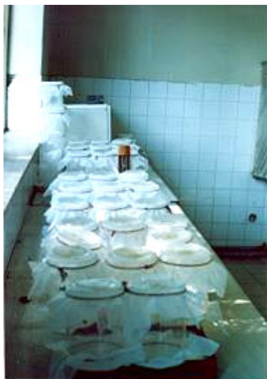
شکل ۹- قفس‌های نگهداری حشرات کامل Fig. 9- Cages for adult surveying