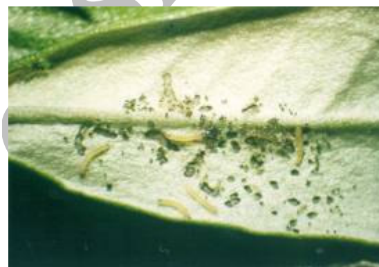
شکل ۴- لاروهای سن یک P. unionalis Fig. 4-Larvae of P. unionalis , instar 1