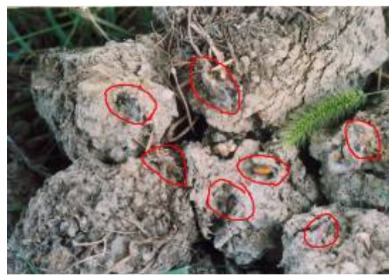
شکل ۶- شفیره‌های P. unionalis در زیر کلوخه‌ها Fig. 6- Pupa of P. unionalis under clods