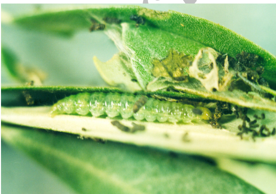
شکل ۵- لارو کامل P. unionalis Fig. 5- Larva of P. unionalis , last instar