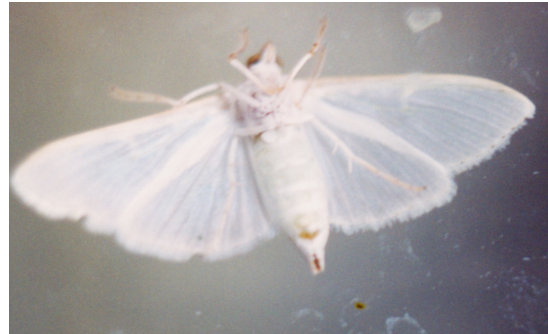
شکل ۲- حشرات بالغ P. unionalis ، راست (ماده) و چپ (نر) Fig. 2-Adults, male (left) and female (right) of P. unionalis