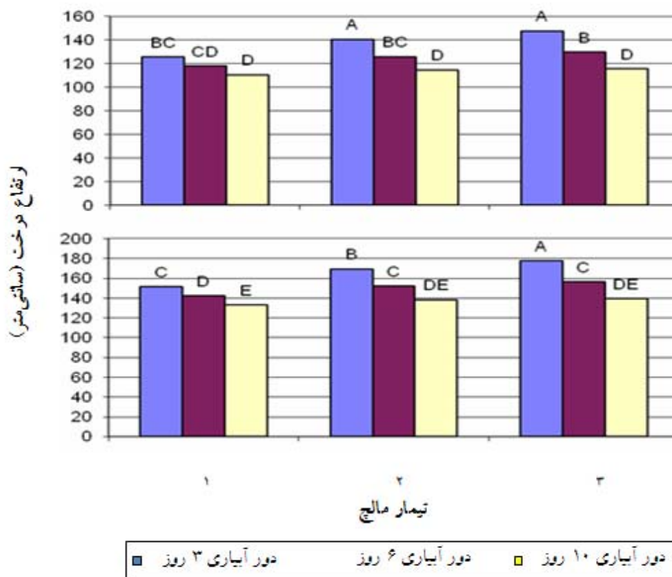
شکل ۳- اثر متقابل مالچ در دور آبیاری بر ارتفاع نهال در سال‌های ۱۳۸۷ و ۱۳۸۸ (به ترتیب نمودار بالا و پایین).