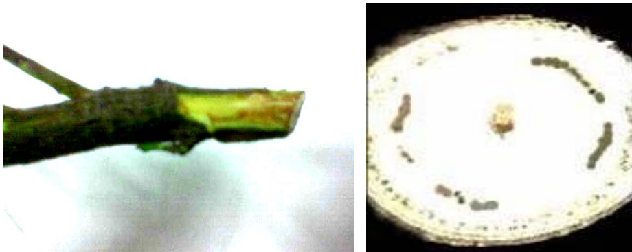
شکل ۲- خطوط ناپیوسته ایجاد شده در برش عرضی و طولی ساقه زیتون مایه‌زنی شده با ( V. dahlia )