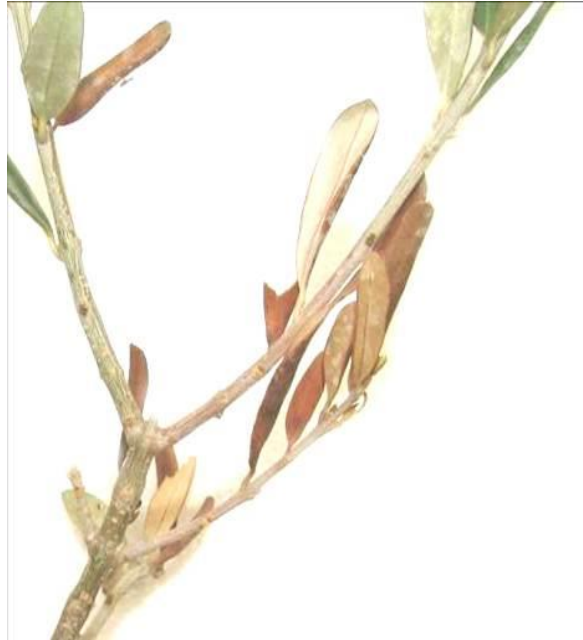
شکل ۱- علائم پژمردگی و خشکیدگی برگ‌های زیتون رقم زرد مایه‌زنی شده با جدایه E4 عامل بیماری ( V. dahliae )

حضور عامل بیماری، ترکیباتی همچون تایلوز و مواد ژلاتینی نیز دیده شد (شکل ۴).