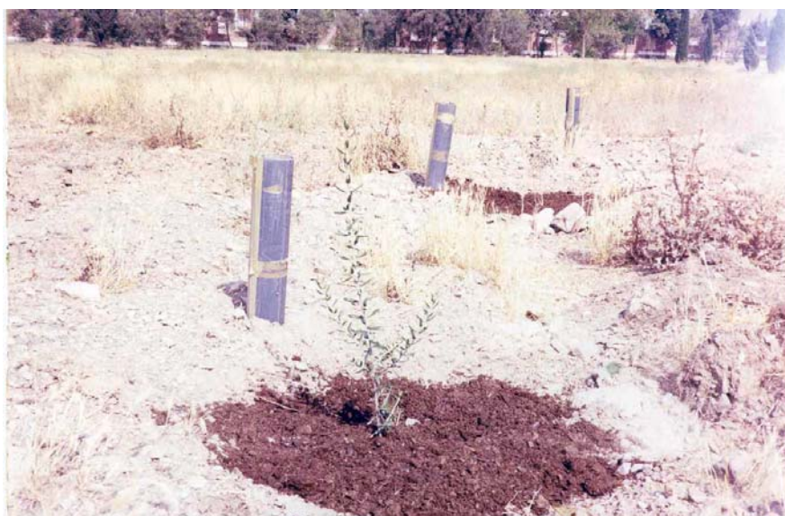
شکل شماره ۲- محل اجرای آزمایش جنگلکاری دیم زیتون در باغ ملی گیاهشناسی ایران (کاربرد مالچ مخلوط کود اسیبی و خرده چوب به شعاع نیم متر نسبت به یقه نهال)